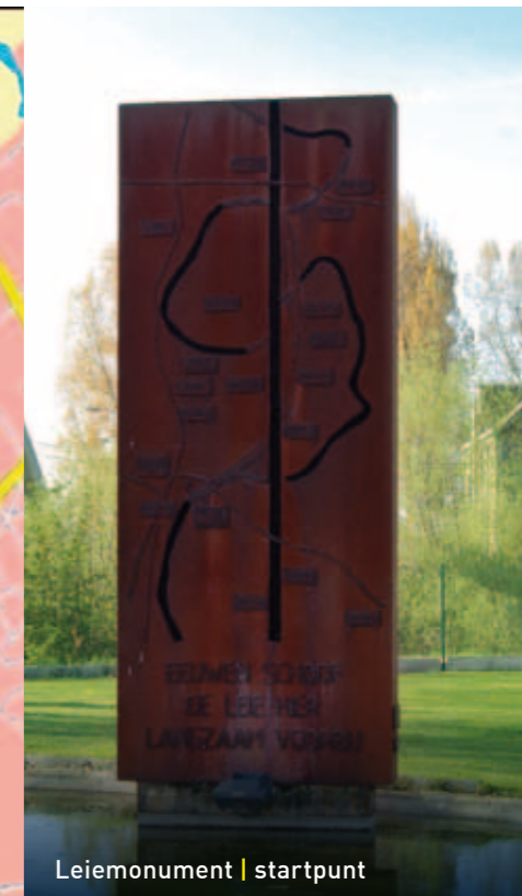
Leimonument | startpunt

We gaan nu terug naar de parking ter hoogte van het Leimonument en starten onze wandeling in de richting van het nieuwe ontmoetingscentrum "Leieheem". Links passeren we de nieuwe lokalen die actief gebruikt worden door een aantal verenigingen van Oeselgem.